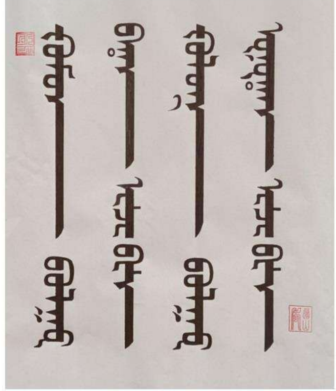
some of artistic fonts writing by Ja Dōsan